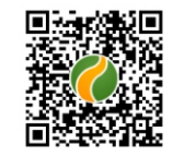
Código QR Estrada Carro